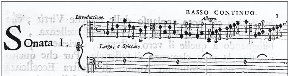
Fragment de l'inici de la Sonata de L.Taglietti recuperada